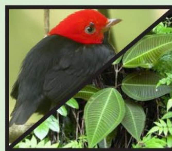
Figure 3 : Mutualisme manakin/mélastomatacées

La densité de la végétation caractérisant la forêt tropicale humide est permise par le travail d'importants disséminateurs de graines, tels que les oiseaux frugivores. L'espèce ci-dessus, le manakin à cuisses jaunes, vue dans une zone de forêt primaire, est membre d'une famille responsable de la majorité de la dissémination des mélastomatacées (une famille de plantes à fleurs abondantes en Amérique tropicale) par la digestion de leurs fruits. Ici, un exemplaire de la famille des mélastomatacées, le Miconia calvescens , ou cancer vert.