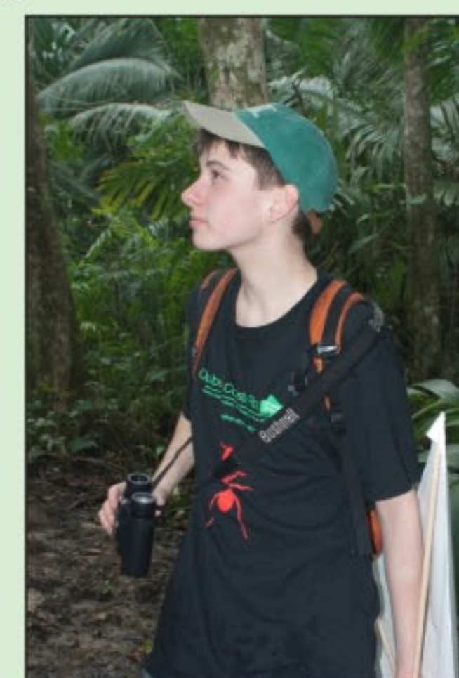
Figure 4 : Observation sur le terrain