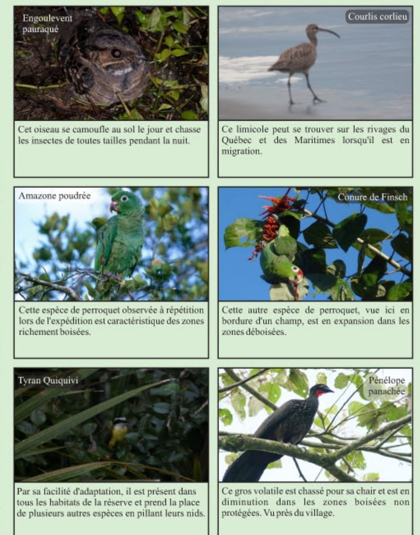
Figure 5 : Spécimens d'oiseaux du Refugio

De plus, l'association entre les deux taxons (Angiospermes et Passereaux) s'est manifestée par le mécanisme de la coévolution: au début de l'ère du Crétacé (il y a 150 millions d'années), les espèces d'oiseaux et de plantes se sont multipliés et ont occupé presque tous les habitats de la planète.