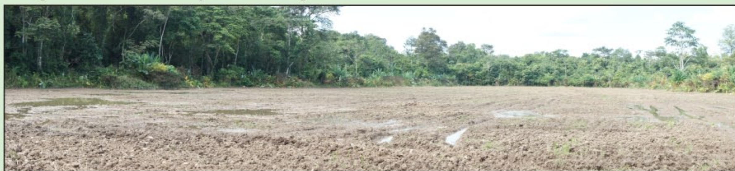
Figure 1 : Zone déboisée adjacente du Refugio

La principale raison du déboisement des forêts en Amérique Centrale est l'expansion de l'agriculture d'exportation. La figure 1 illustre une forêt coupée pour laisser place à une plantation de riz. Cette coupe à blanc de 16,9 ha. détruit non seulement l'habitat des oiseaux mais contribue à la fragmentation du territoire. La conséquence écologique est l'isolement génétique des populations et le déclin des espèces.