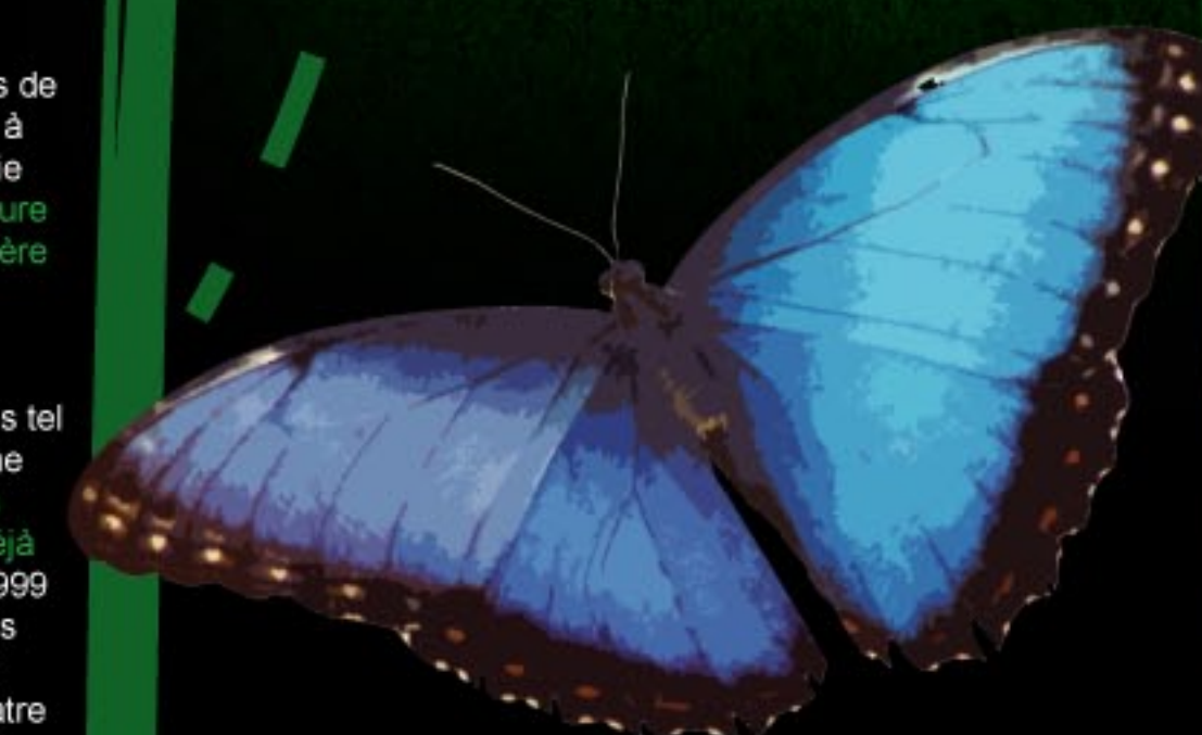
Au Costa Rica, il est possible d'observer une grande variété d'espèce de morpho bleu tel que celui ci-dessus. À partir de la chenille d'un morpho bleu, EntoMed a isolé un peptide (ETD-10) aux propriétés antibactériennes.

Compte-tenu du problème de résistance aux antibiotiques tel qu'exprimé par l'OMS, ces molécules de petite taille représentent une intéressante alternative aux antibiotiques connus. En effet, plusieurs molécules antifongiques, anticancéreuses et antibactériennes ont déjà été développées notamment par les laboratoires d'EntoMed entre 1999 et 2005. Cette société située près de Strasbourg avait découvert plus d'une centaine de molécules d'intérêt thérapeutique provenant de substances naturelles produites par divers insectes récoltés aux quatre coins du globe. Les divers peptides découverts par EntoMed avaient pour propriété d'accélérer la réponse du système immunitaire. Théoriquement, cela pourrait permettre l'élaboration de traitements pour les cas d'immunodéficience tels que les patients ayant subi une transplantation ou ceux atteints du Sida. Bref, les peptides provenant de substances naturelles pourraient non seulement apporter une solution au problème de résistance aux antibiotiques, mais aussi permettre de développer des traitements contre le cancer et contre des problèmes d'immunodéficience.