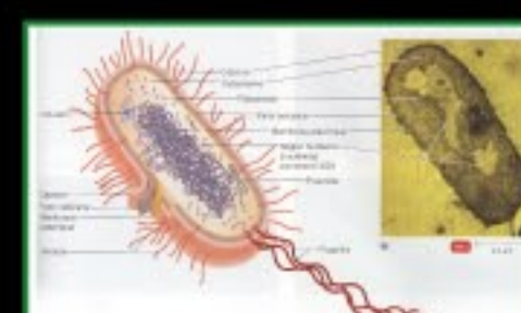
Figure 2 : Principales structures d'une bactérie TORTORA, Gérard et al., Introduction à la microbiologie, Saint-Laurent, Épi, 2003, p.89.